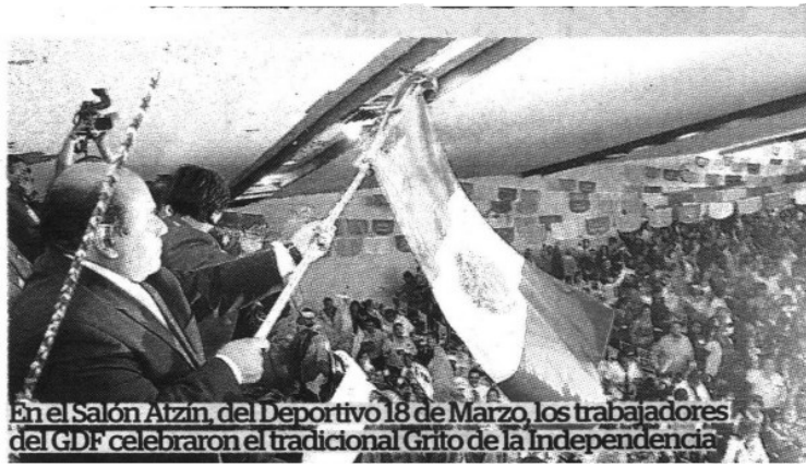
En el Salón Atzín, del Deportivo 18 de Marzo, los trabajadores del GDF celebraron el tradicional Grito de la Independencia